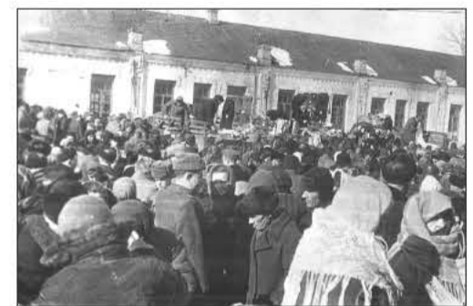
Миргородський базар початку 1950-их років.

голя, № 107) на початку ХХ ст. існували так звані «мебльовані кімнати», тобто готель міщанина Каца. З приходом радянської влади ці «кімнати» націоналізували і в 20-их роках там відкрили «Селянський будинок», по суті, той самий готель. На початку грудня 1933 року миргородська влада поселила в ньому прибулого поета Павла Тичину, який і написав тут свої відомі дві «Пісні трактористки», в яких прославляв «нове життя». Письменник-миргоро-