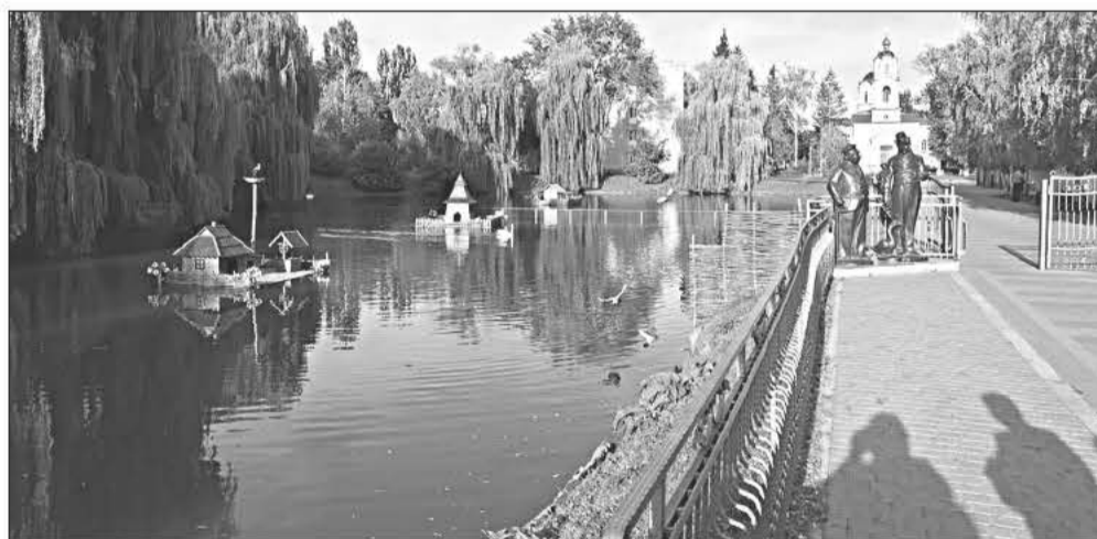
Нинішня дорога до Успенського собору – це частина колишньої вулиці Базарної.

років. У 30-их роках у підвалах цих будинків тримали репресованих «ворогів народу» перед відправленням їх до харківських чи лубенських тюрем. Під час нацистської окупації, в 1941 – 1943 рр., там розміщалося гестапо, де теж кували людей. Згодом, під час будівельних робіт, у траншеях навколо цих будинків знаходили численні останки закатованих (невідомо якою владою). Поряд, на цьому ж самому розі вулиць Базарної й Гоголя (тоді за адресою Го-